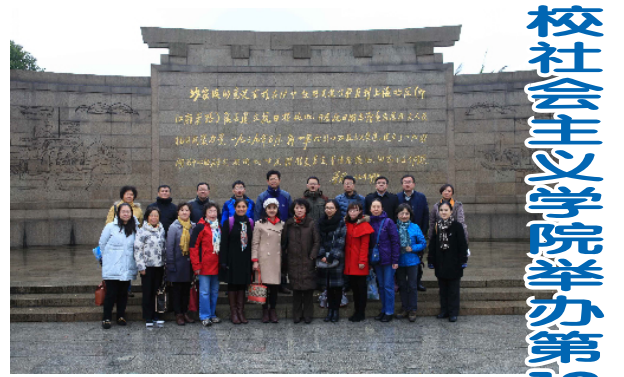
校社会主义学院举办第12期统战理论培训班

老领导、劳模和党外代表人士对学校领导的关心表示感谢,他们充分肯定了学校近年来各项事业取得的显著成就,希望全校师生勠力同心,再创佳绩。校领导诚挚感谢前辈们为学校事业做出的突出贡献和打下的坚实基础,希望他们在保重身体的同时,一如既往地关心支持学校事业发展,并衷心祝愿他们身体健康、阖家幸福。