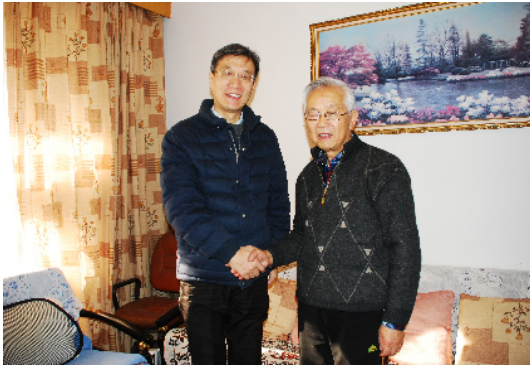
瑞猴呈祥辞旧岁,金鸡报晓迎新年。在新春佳节即将到来之际,学校领导在党办、校办、统战部、离退休

休工作处、工会等部门负责同志陪同下,走访慰问了部分离退休老领导、省部级劳模和党外代表人士,代表学校向他们送去节日的问候和美好的祝福。